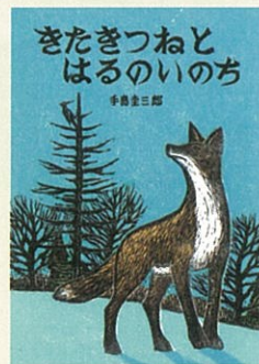
絵本『きたきつねとはるのいのち』 2021年 絵本塾出版

新型コロナウイルス感染拡大により変更が生じた場合は、ホームページ等でお知らせします。 ※混雑時には入場にお時間をいただく場合があります。