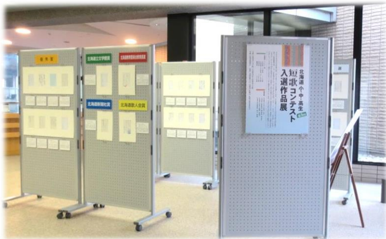
過去の作品展の様子